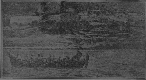
Una vista de Agadir, donde los alemanes hicieron el desembarque de sus tropas